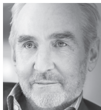
Ludwig Hasler

Raffaella Romagnolo: Bella Ciao / Destino